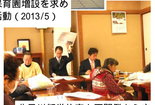
北品川都営住宅を再開発から守れ」住民集会で報告（2013/2）

住民追い出し・商店街壊しの補助29号線・放射2号線の白紙撤回と、住民参加の防災計画策定 高層マンション建設から池田山の住環境を守る 大崎図書館の存続 認可保育園・特養老人ホーム・認知症グループホームの増設 駅のベンチ設置とバリアフリー化、公園のトイレ改善でやさしいまちづくり コミュニティバスの運行 高齢者の緊急通報システムの無料化で孤独死を防ぐ 介護士と保育士の待遇改善でワーキングプアを無くす