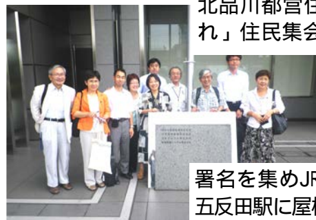
署名を集めJR東日本と交渉。五反田駅に屋根設置へ（2011/7）

住民追い出し・商店街壊しの補助29号線・放射2号線の白紙撤回と、住民参加の防災計画策定 高層マンション建設から池田山の住環境を守る 大崎図書館の存続 認可保育園・特養老人ホーム・認知症グループホームの増設 駅のベンチ設置とバリアフリー化、公園のトイレ改善でやさしいまちづくり コミュニティバスの運行 高齢者の緊急通報システムの無料化で孤独死を防ぐ 介護士と保育士の待遇改善でワーキングプアを無くす