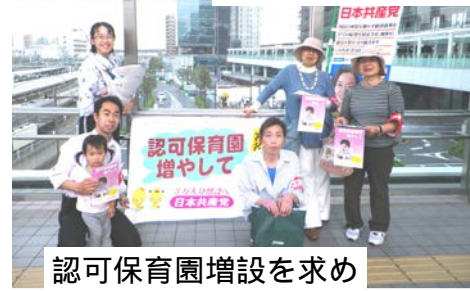
認可保育園増設を求め署名活動（2013/5）