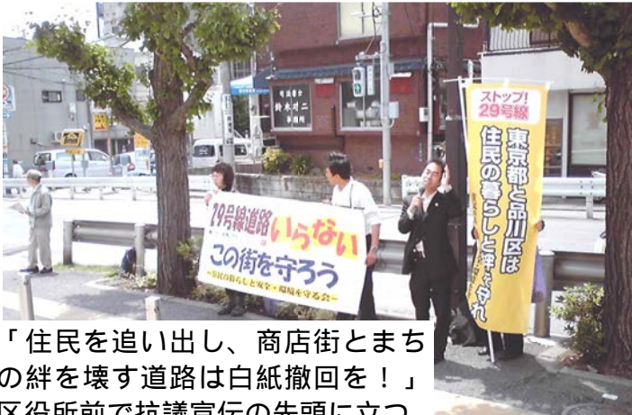
「住民を追い出し、商店街とまちの絆を壊す道路は白紙撤回を！」 区役所前で抗議宣伝の先頭に立つ