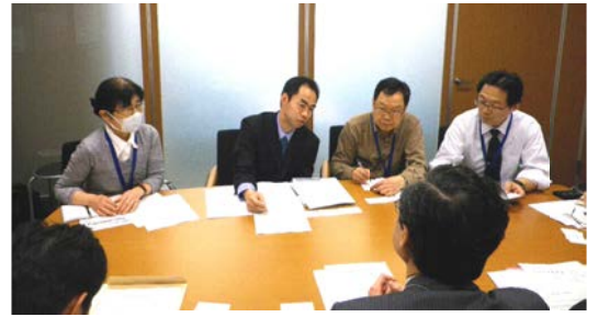
西品川郵便局移転問題で地域の皆さんと総務省交渉。代替サービスの実施へ（2014/4）