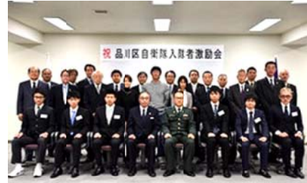
2015年度「激励会」の様子

品川区は、自衛隊入隊・入校予定者激励会を毎年区役所で開催。品川の若者・自衛隊員を戦場に送り、その背中を押す事になる激励会は中止し、戦法Ⅱ安保法制は廃止すべきです。一緒に力合わせましょう。