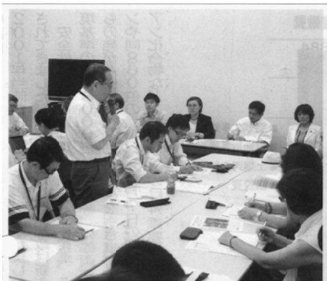
道路計画による住民直いだしに批判の声が相次いだ懇談＝2日、千代田区