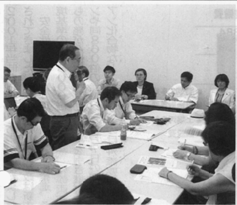
道路計画による住民直いだしに批判の声が相次いだ懇談＝2日、千代田区