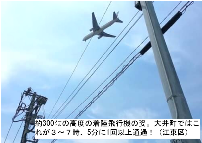
約300mの高度の着陸飛行機の姿。大井町ではこれが3〜7時、5分に1回以上通過！（江東区）