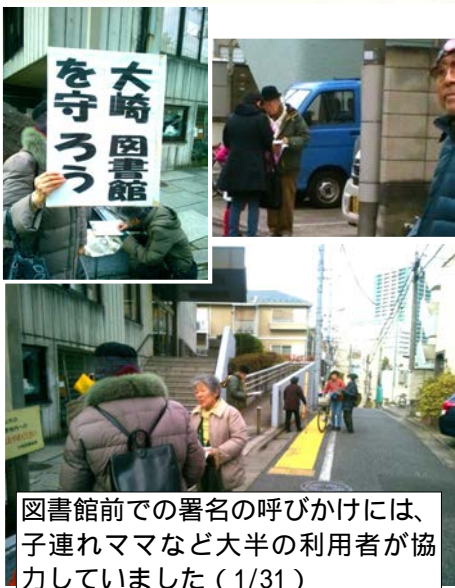
図書館前での署名の呼びかけには、子連れママなど大半の利用者が協力していました（1/31）

【結論】御殿山小西側には「移転」でなく図書館の新規開設を。29号線は中止し大崎図書館は必要な補修を行い現地存続。2階スペースも活用し更に良い施設へしていくべきです！