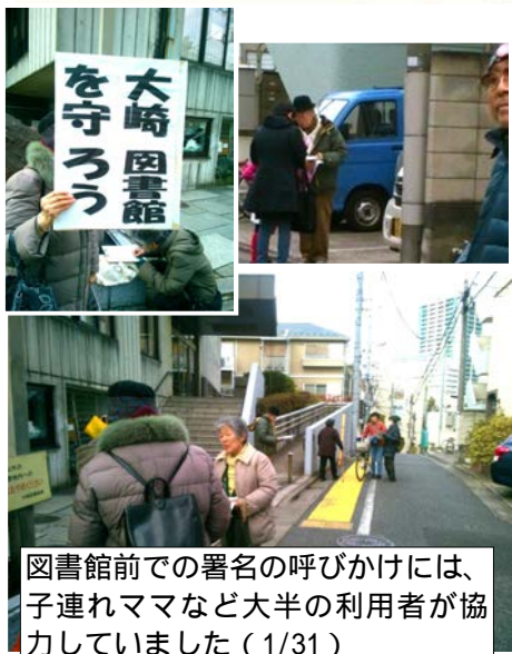
図書館前での署名の呼びかけには、子連れママなど大半の利用者が協力していました（1/31）

【結論】御殿山小西側には「移転」でなく図書館の新規開設を。29号線は中止し大崎図書館は必要な補修を行い現地存続。2階スペースも活用し更に良い施設へしていくべきです！