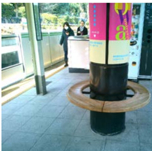
右) 恵比寿駅 左上) 原宿駅