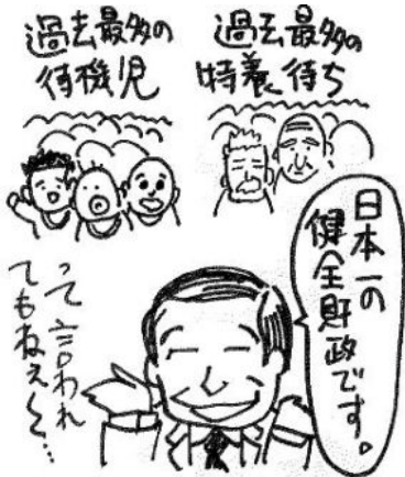
イラスト：安藤たい作

待機者過去最多の一方、「健全財政日本一」自慢直近14年3月の選挙結果によると、区内の特養ホーム待機者は611人と過去最多に区は3ヶ所231人分の増設計画を発表していますが、以後の計画の具体化は「国の動向や需要を見て」と拒否。しかし足りないのは明らかです。一方、区の貯金は23区平均比で百億円も多い71.2億円で、区長自ら「日本一の健全