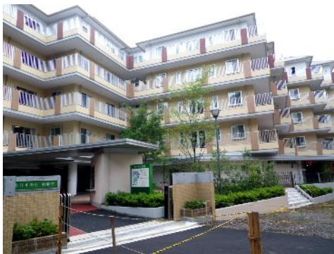
港区の特別養護老人ホーム、介護老人保健施設などが集まった複合型介護施設、「ありすの杜 南麻布」(2010/8/9視察時に安藤撮影)

財政」と公言。百人定員の特養ホームの建設費は約20億円です。「住み続けたいまち品川」を標榜するならば、身近な地域に特養ホームを増やすのは不可欠です。活用可能なビル床がそんな中、1月21日の行革委で区内2ヶ所目となる老人保健施設の計画が報告されました。北品川5丁目の区有地にビルを建て、老健と文化施設(図書館を検討)を入れるというもの。しかし、それでも延床面積