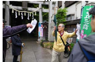
戸越八幡の鳥居の脇スレスレを20cm道路。おごそかな参道の雰囲気台無しに。