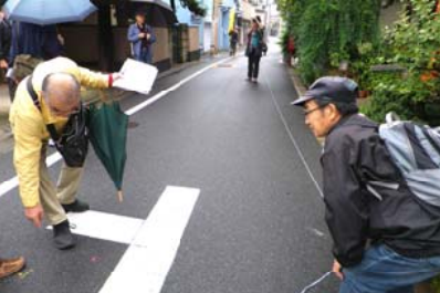
既に測量され紙が打たれているポイントなどを確認し、20cmの紐を貼り、実際の道路幅をイメージしながら歩きました。(豊町)