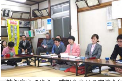
戸越銀座まで歩き、感想や意見の交流を行いました。この会館のある戸越銀座商店街も道路で寸断され大打撃になります。