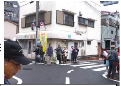
歩きながら辻辻で住民の会の事務局さんの現地説明を聞く。