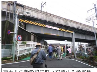
西大井の新幹線線路と交差する予定地。橋脚の角度が、道路がいつ通ってもよいようにここだけナナメになっています。