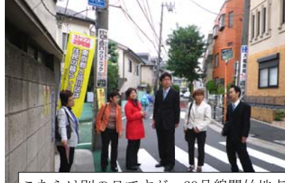
こちらは別の日ですが、29号線開始地点となる大崎を品川区議団と視察。「測量反対」のステッカーやのぼりがあります。