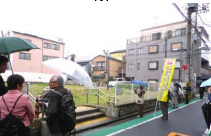
現在は広場だが、将来道路が通ったら高層ビルを建て共同化し、地権者の代替地とされる予定の場所(二葉)。