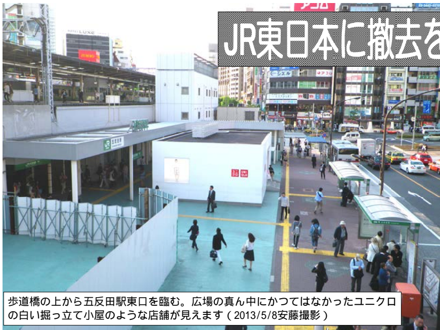
歩道橋の上から五反田駅東口を臨む。広場の真ん中にかつてはなかったユニクロの白い掘り立て小屋のような店舗が見えます（2013/5/8）

前号で大崎駅山手線ホームのベンチ消失問題を取り上げましたが、「私もおかしいと思っていました」の反響。更に隣の五反田駅も、駅前広場に建った店舗建物について「あれは何なのか。調べて取り上げて欲しい」との声が届きました。