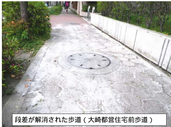
段差が解消された歩道（大崎都営住宅前歩道）

場所は大崎都営住宅（1階が大崎保育園）前の歩道。マンホールが盛り上がり、段差となり、シルバーカーで買い物に行く高齢者の方、ベビーカーを押して送り迎えする若夫婦などが困っていました。実