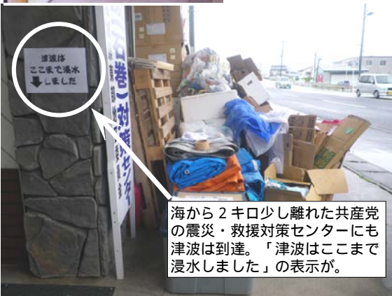
海から2キロ少し離れた共産党の震災・救援対策センターにも津波は到達。「津波はここまで浸水しました」の表示が。

と見積もられてい。ます。この国は、正の一次補償の撤去予算は、なんと、3519億円。分しかありません。一方、ボランティアだけでは限界があります。国が責任をもち、仕事がない地元や若者に雇用場の場として復興作業を担う