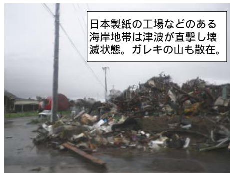
日本製紙の工場などのある海岸地帯は津波が直撃し壊滅状態。ガレキの山も散在。

石巻の市街地は46%が水に浸かり、工業港などがある海岸は津波で壊滅、空襲の跡さながらの状態でした。あちこちにガレキの山。私も二日間泥だし作業をしました。頼の極々一部に過ぎず、復興の道のりはまだまだ遠いというのが実感です。今回の震災で石巻市では百年分のガレキが出、撤去費用は3500億円