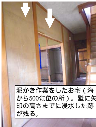
泥かき作業をしたお宅（海から500位の所）。壁に矢印の高さまでに浸水した跡が残る。

石巻の市街地は46%が水に浸かり、工業港などがある海岸は津波で壊滅、空襲の跡さながらの状態でした。あちこちにガレキの山。私も二日間泥だし作業をしました。頼の極々一部に過ぎず、復興の道のりはまだまだ遠いというのが実感です。今回の震災で石巻市では百年分のガレキが出、撤去費用は3500億円